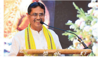
सूख-दुख में सरकार के समर्थन पर जोर दिया। प्रधानमंत्री नरेंद्र मोदी के समर्थन में 2047 तक भारत को विकास के शिखर पर पहुंचाने की उद्देश्य जनता और सभी से इस लक्ष्य में भागीदार बनने की अपील की। उन्होंने सरकारी कार्यक्रमों को तेजी से लागू करने और लोगों के